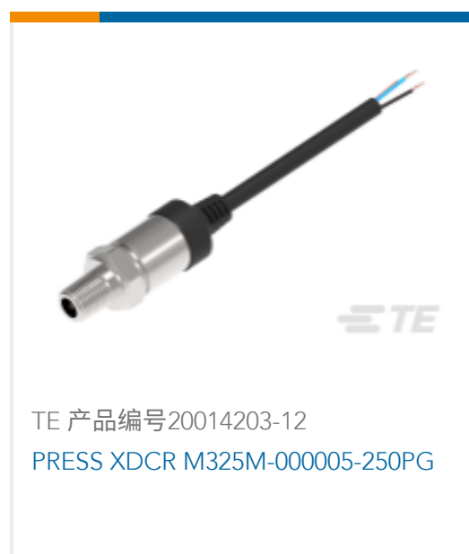
TE 产品编号 20014203-12 PRESS XDCR M325M-000005-250PG