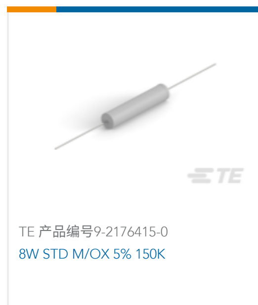
TE 产品编号 9-2176415-0 8W STD M/OX 5% 150K