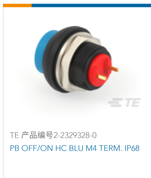
TE 产品编号 2-2329328-0 PB OFF/ON HC BLU M4 TERM. IP68