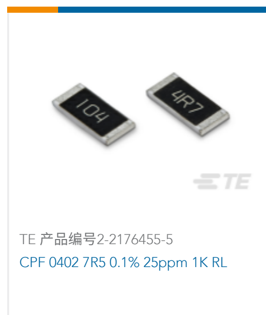
TE 产品编号 2-2176455-5 CPF 0402 7R5 0.1% 25ppm 1K RL