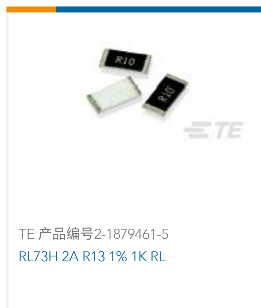
TE 产品编号 2-1879461-5 RL73H 2A R13 1% 1K RL