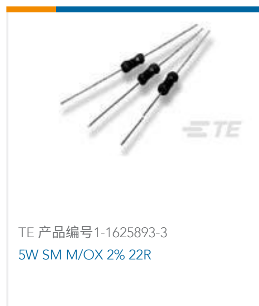
TE 产品编号 1-1625893-3 5W SM M/OX 2% 22R