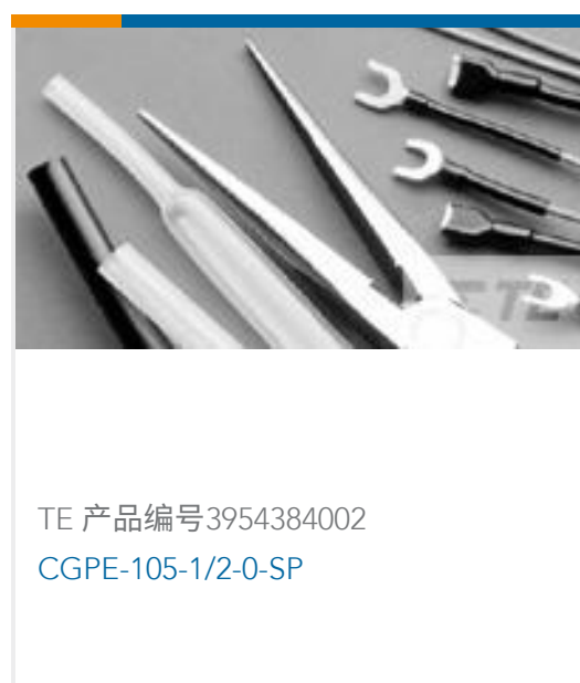
TE 产品编号 3954384002 CGPE-105-1/2-0-SP