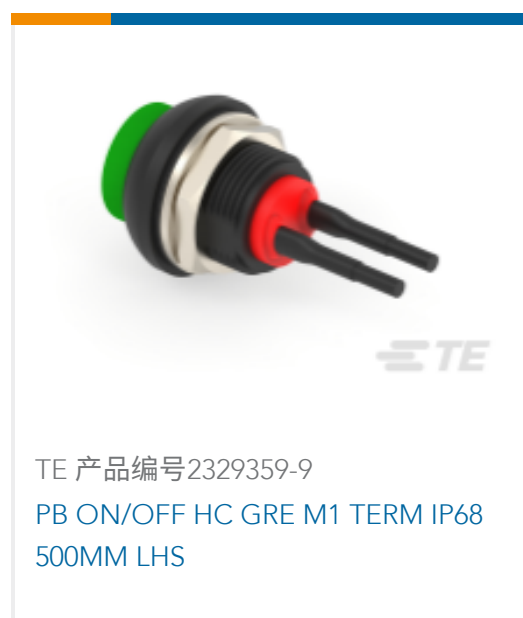
TE 产品编号 2329359-9 PB ON/OFF HC GRE M1 TERM IP68 500MM LHS