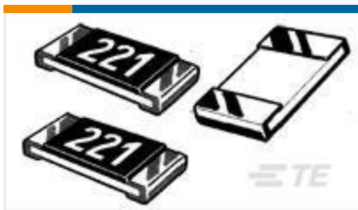
TE 产品编号1-1622820-3 3520 18R 5%