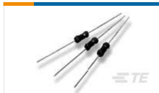
TE 产品编号7-1625890-1 2W SM M/OX 5% 82R