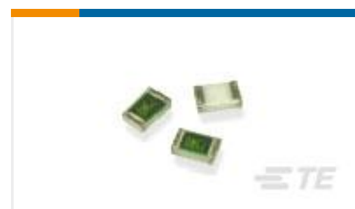
TE 产品编号1676461-2 RN 0805 90K9 0.1% 10PPM 1KRL