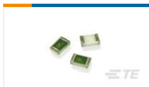
TE 产品编号1676218-2 RN 0805 1K02 0.1% 10PPM 1KRL