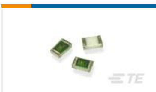
TE 产品编号1676472-2 RN 0805 9K09 0.1% 10PPM 1KRL