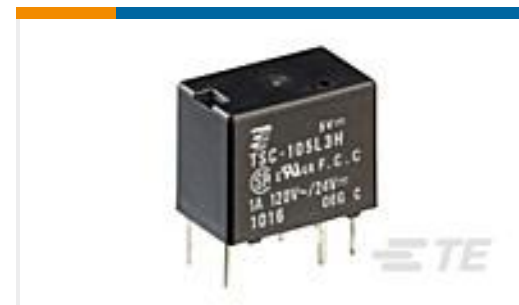
TE 产品编号2-1419130-4 TSC-112L3H,000