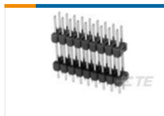
TE 产品编号5-146496-2 04 MODII HDR DRST UNSHRD STKG