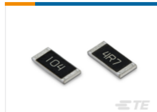
TE 产品编号2-2176455-5 CPF 0402 7R5 0.1% 25ppm 1K RL