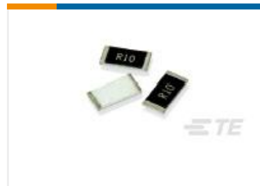
TE 产品编号2-1879461-5 RL73H 2A R13 1% 1K RL