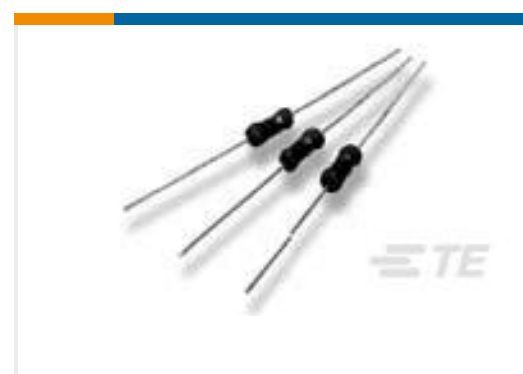
TE 产品编号1-1625893-3 5W SM M/OX 2% 22R