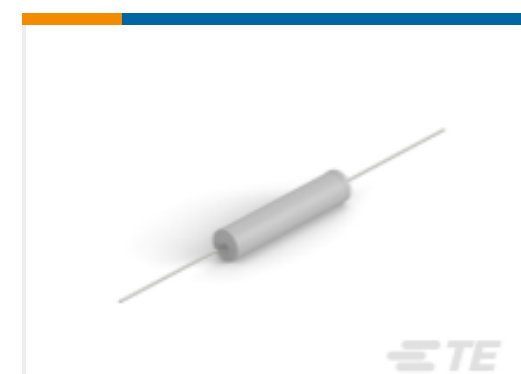
TE 产品编号9-2176415-1 8W STD M/OX 5% 160K