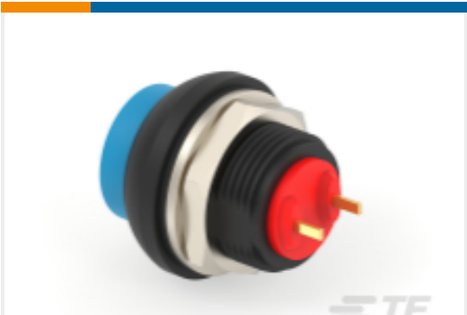
TE 产品编号2-2329328-0 PB OFF/ON HC BLU M4 TERM. IP68