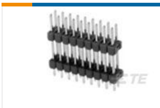
TE 产品编号5-146496-2 04 MODII HDR DRST UNSHRD STKG