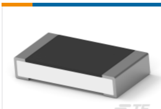
TE 产品编号1-2176391-0 RQ 1206 15K4 0.1% 10PPM 5K RL