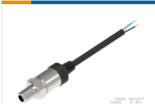
TE 产品编号20014203-12 PRESS XDCR M325M-000005-250PG