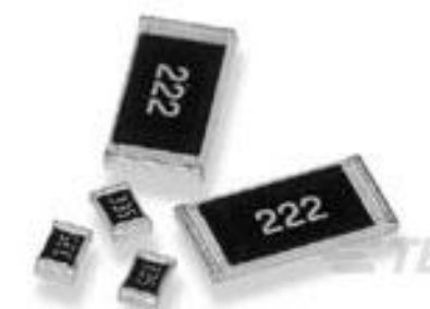
TE 产品编号 1-1879502-0 CRGH2512 5% 33K 2W