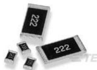
TE 产品编号 1879513-1 CRGH1206 1% 10R 0.5W