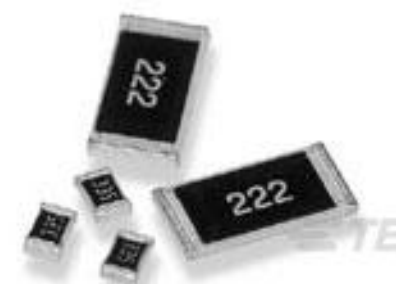
TE 产品编号 6-1879501-0 CRGH2512 5% 300R 2W