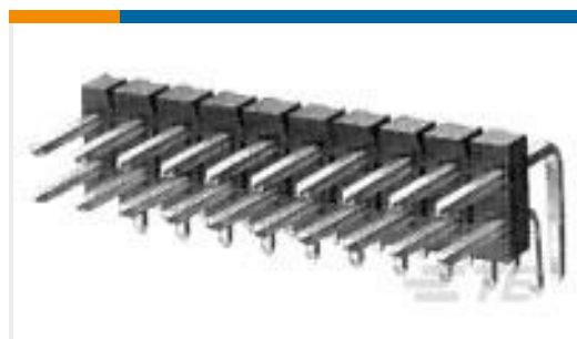
TE 产品编号826662-4 4P AMPMODU II STIFT LEI