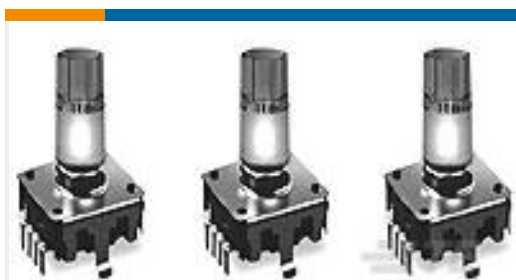
TE 产品编号 4-1879314-5 DPL12S 24P 24DET 25K RD/GRN