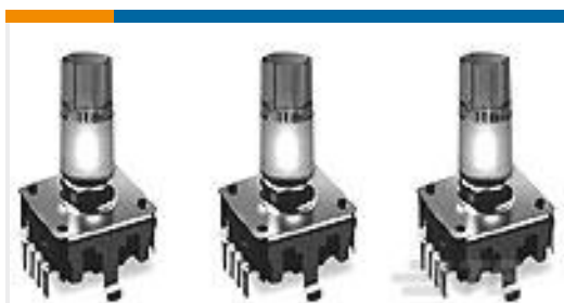
TE 产品编号 2-1879749-3 LED ENCODER 12MM HORIZ SW GR /RD