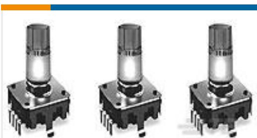
TE 产品编号 1-1879749-7 LED ENCODER 12MM HORIZ SW GR /RD