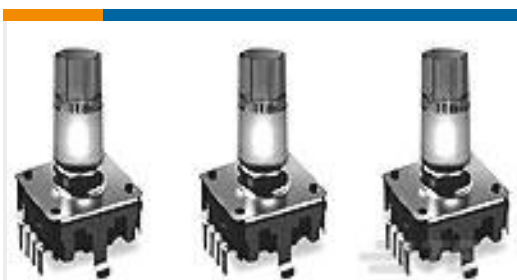
TE 产品编号 4-1879314-7 DPL12S 24P 24DET 21F RD/GRN