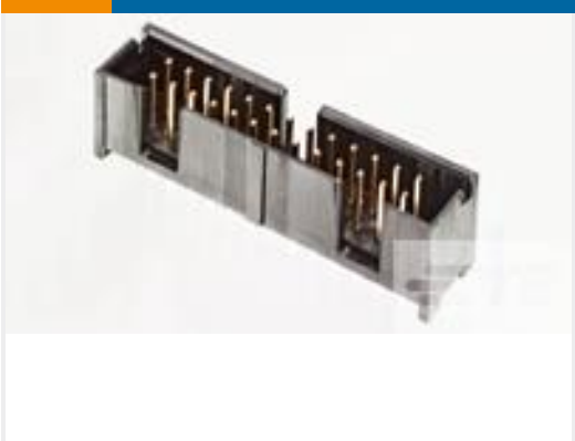
TE 产品编号2-1761603-9 IDC LOW PRO HDR 26P VERT BLUE