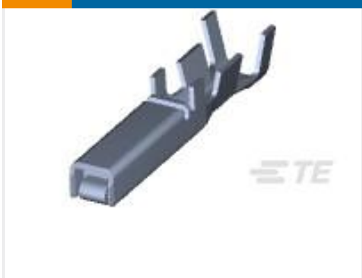
TE 产品编号175196-3 DYNAMIC D-3 REC CONT/L AU 0.76