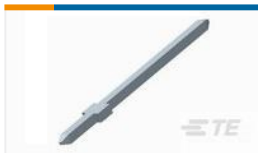
TE 产品编号1-928836-5 MOD2 STIFT M A-PIN