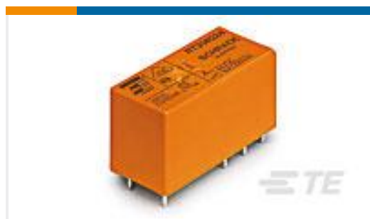
TE 产品编号9-1393243-9 RT444024