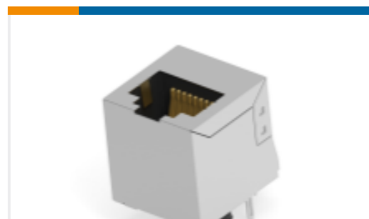
TE 产品编号133184-E MJ HS V5 * 8 8 * * * * 30 * J 3 133819