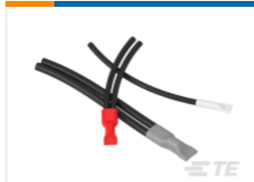
TE 产品编号526003N010 TC-CAPS-4005-8CS5655