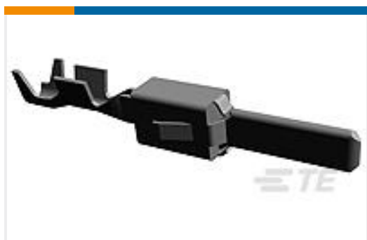
TE 产品编号1-962842-1 TAB 2.8x0.8 CONTACT CS SRC Sn