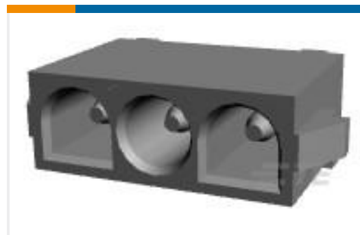
TE 产品编号350789-1 03P UMNL PIN HDR ASSY 94VO