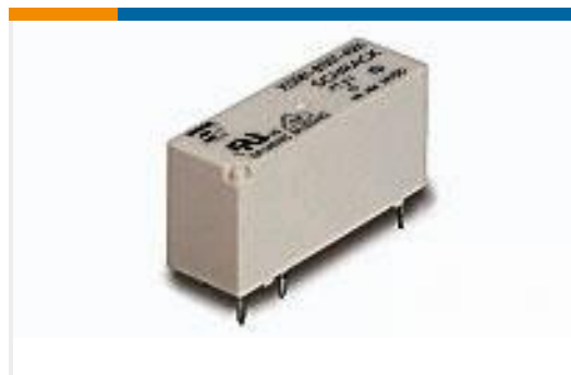
TE 产品编号2-1393222-0 V23061A1005A302=MINISTARKSTROM