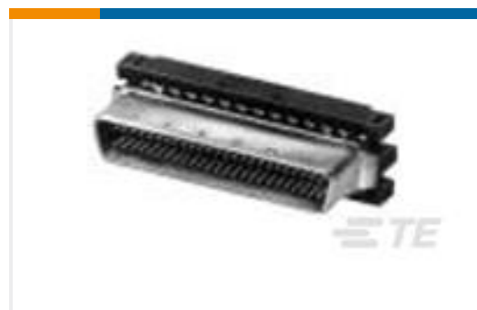
TE 产品编号5749621-2 26 50S CABLE PLUG CONN/COV KIT