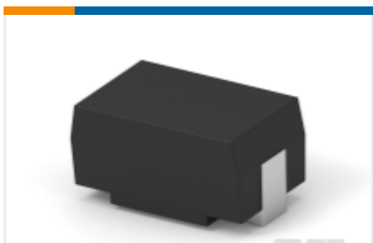
TE 产品编号1-1879021-3 SMD 功率电阻器：7 瓦特，.10-500 欧姆