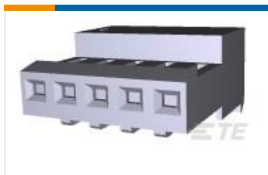
TE 产品编号3-640441-5 05P MTA100 CONN ASSY WHT