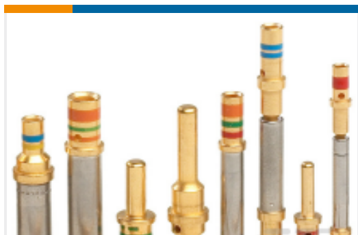
TE 产品编号4162-201-1631L CONT SOC ASSY