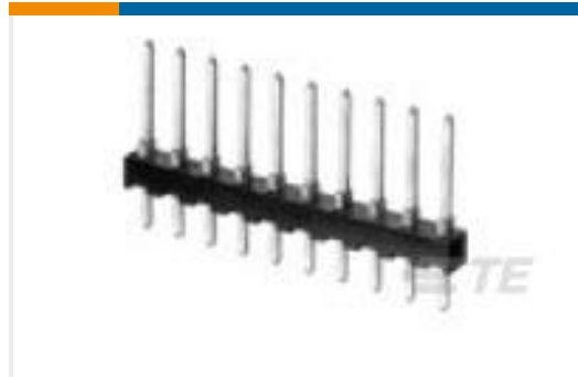
TE 产品编号87220-4 04 MODII HDR SRST UNSHRD .100