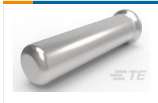
TE 产品编号147444-1 SOCKET,MIN-SPR AU-AU SER-1