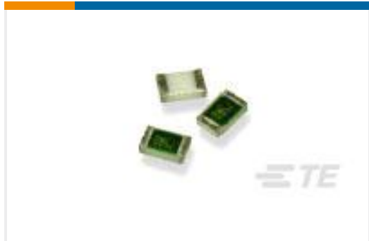
TE 产品编号3-1676481-9 CPF 0603 220R 0.1% 25PPM 1K RL