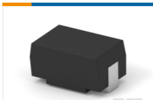
TE 产品编号1-1879011-7 SMD 功率电阻器 : 7 瓦特 , 200-2M 欧姆