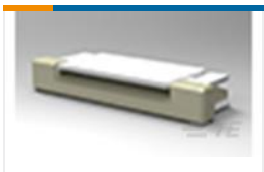
TE 产品编号1-1734839-0 FPC CONN. 0.5MM PITCH T/C,10P