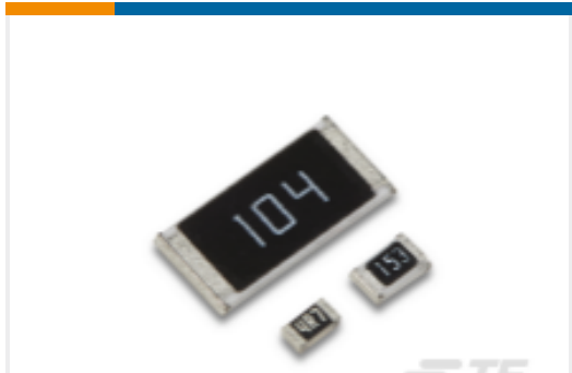
TE 产品编号3-2176349-6 CRGCQ 2512 8K2 1%