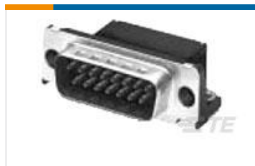
TE 产品编号5747832-4 09 MSFL PLUG RA 590 (IN,FM,BL)