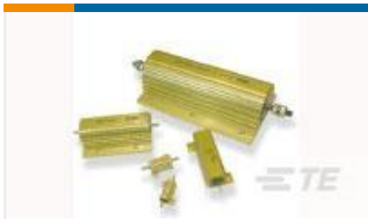
TE 产品编号9-1625971-5 HSA25 R01 10%