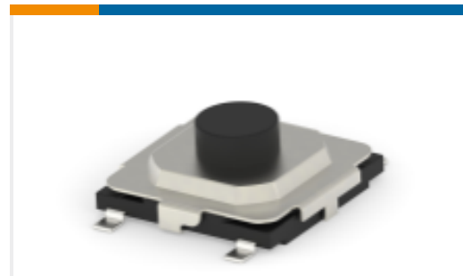
TE 产品编号2337238-3 TACT MINI GW 5.2X5.2X2 160GF