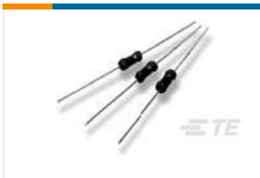
TE 产品编号7-1879354-5 RR03 5% 390R AMMO