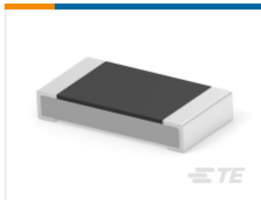
TE 产品编号2-2176392-9 RQ 1206 261K 0.1% 10PPM 5K RL