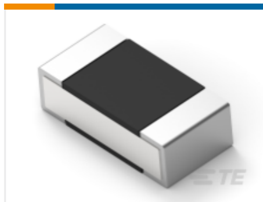
TE 产品编号7-2176305-3 RP 1E 0.1W 604R 0.1% 25PPM 5K RL