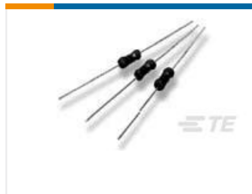
TE 产品编号1-1879353-9 RR02 5% 24K AMMO