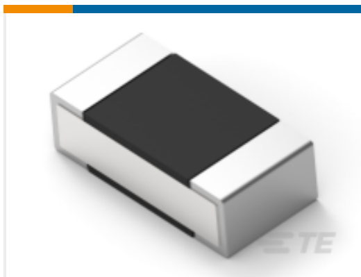
TE 产品编号3-2176307-2 RP 1E 0.1W 26K1 0.1% 25PPM 5K RL