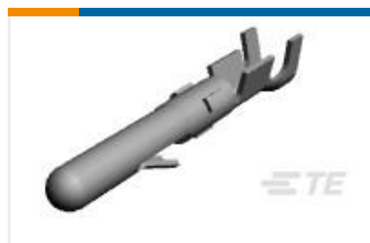
TE 产品编号61116-4 CMNL PIN 24-18 PTPHBZ