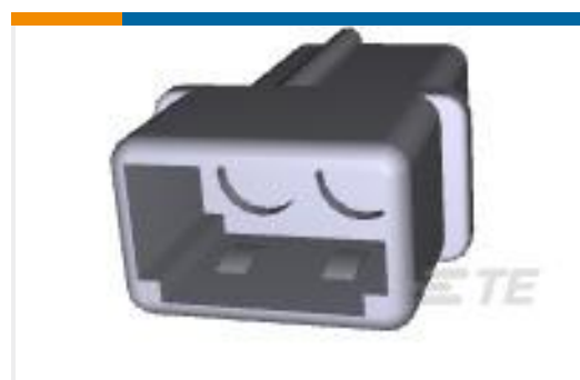
TE 产品编号1-480319-0 02P CMNL CAP HSG NATL