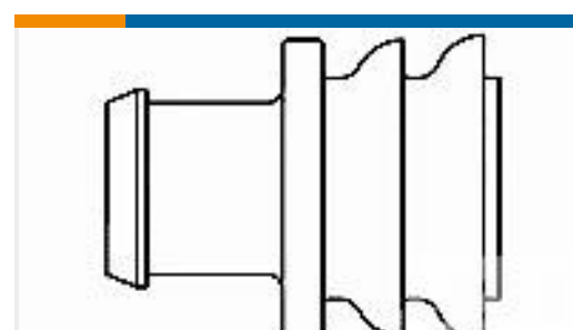
TE 产品编号281934-2 SINGLE WIRE SEAL