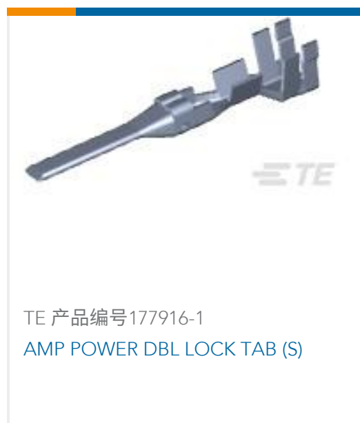
TE 产品编号177916-1 AMP POWER DBL LOCK TAB (S)