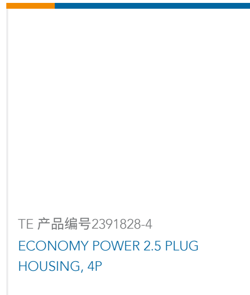
TE 产品编号2391828-4 ECONOMY POWER 2.5 PLUG HOUSING, 4P