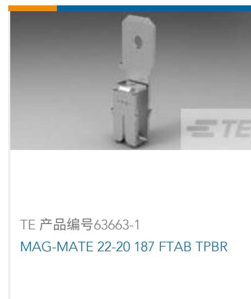
TE 产品编号63663-1 MAG-MATE 22-20 187 FTAB TPBR