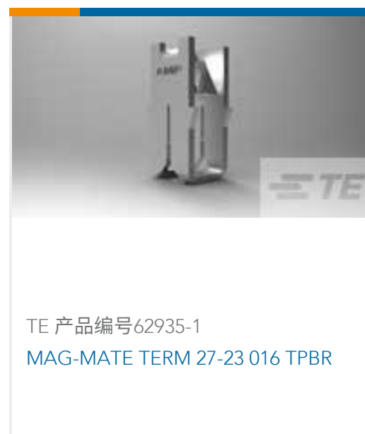
TE 产品编号62935-1 MAG-MATE TERM 27-23 016 TPBR