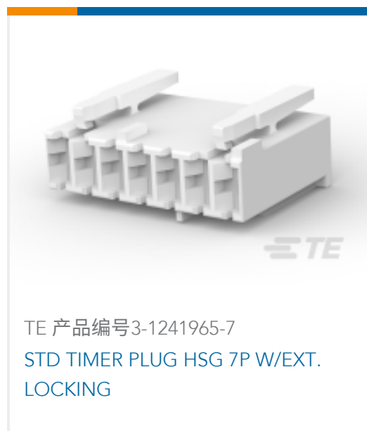
TE 产品编号3-1241965-7 STD TIMER PLUG HSG 7P W/EXT. LOCKING