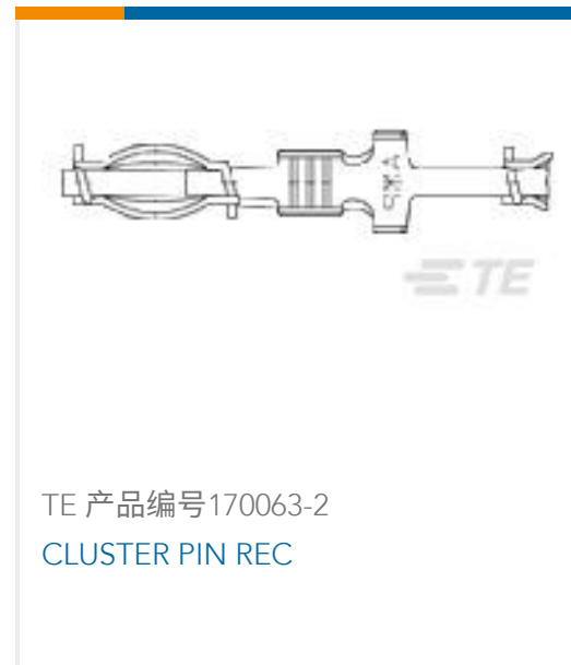
TE 产品编号170063-2 CLUSTER PIN REC