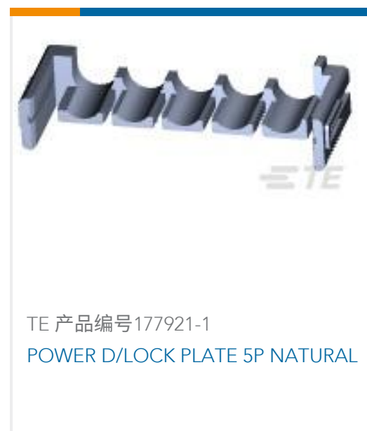
TE 产品编号177921-1 POWER D/LOCK PLATE 5P NATURAL