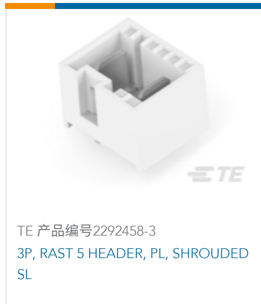
TE 产品编号2292458-3 3P, RAST 5 HEADER, PL, SHROUDED SL