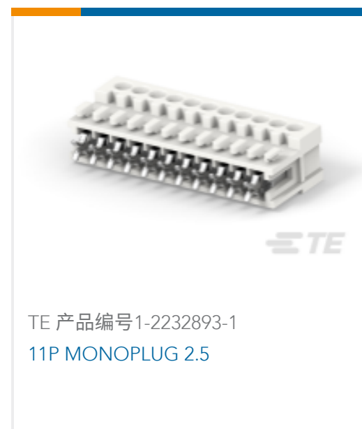
TE 产品编号1-2232893-1 11P MONOPLUG 2.5