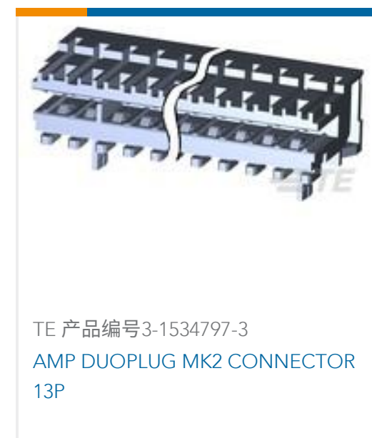
TE 产品编号3-1534797-3 AMP DUOPLUG MK2 CONNECTOR 13P