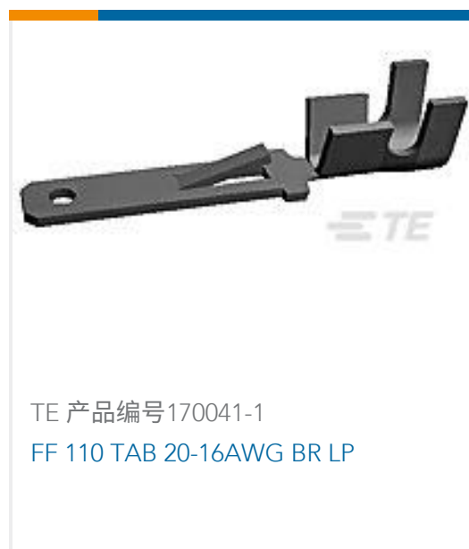
TE 产品编号170041-1 FF 110 TAB 20-16AWG BR LP