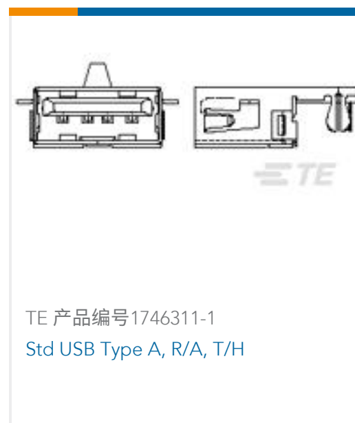
TE 产品编号1746311-1 Std USB Type A, R/A, T/H