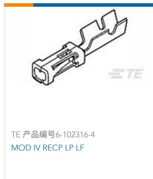
TE 产品编号6-102316-4 MOD IV RECP LP LF