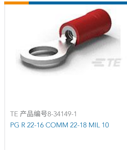
TE 产品编号8-34149-1 PG R 22-16 COMM 22-18 MIL 10