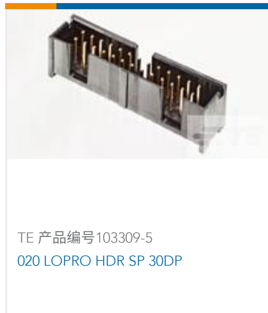
TE 产品编号103309-5 020 LOPRO HDR SP 30DP