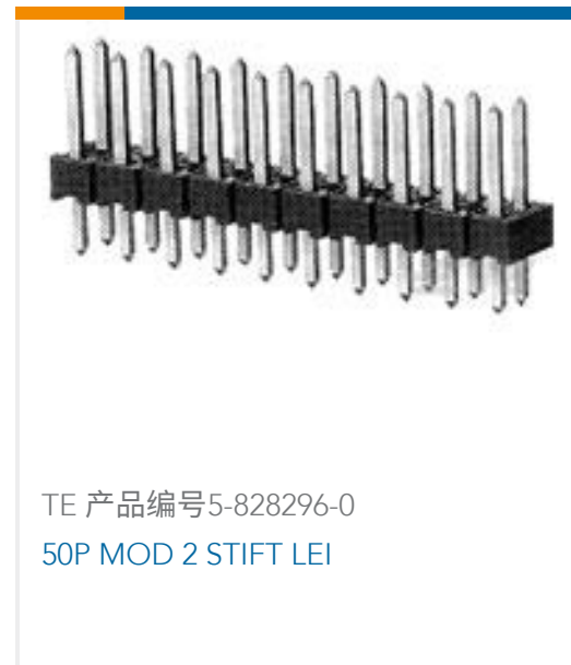
TE 产品编号5-828296-0 50P MOD 2 STIFT LEI