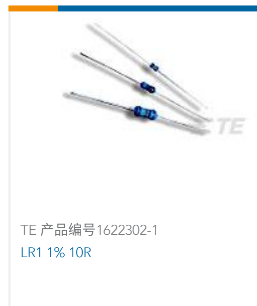
TE 产品编号1622302-1 LR1 1% 10R