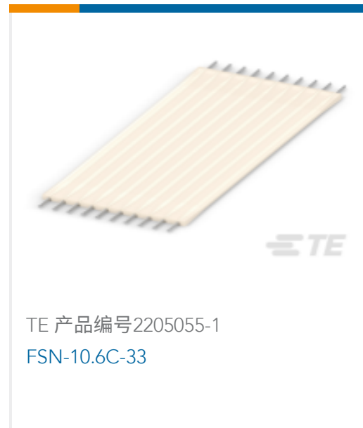
TE 产品编号2205055-1 FSN-10.6C-33