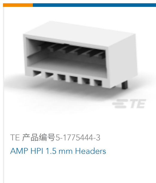
TE 产品编号5-1775444-3 AMP HPI 1.5 mm Headers