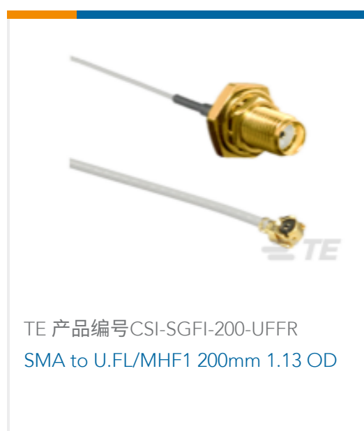
TE 产品编号CSI-SGFI-200-UFFR SMA to U.FL/MHF1 200mm 1.13 OD