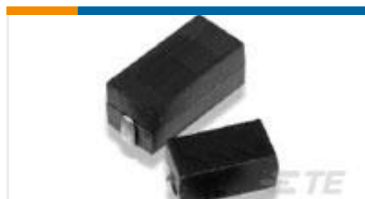
TE 产品编号8-1879021-3 SMW3 270R 5%