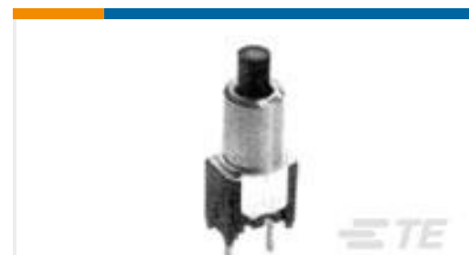
TE 产品编号1825100-7 TPF11FGPC004