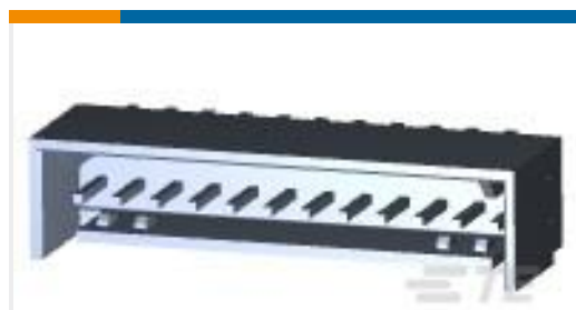
TE 产品编号3-644861-2 12P MTA100 SHRD HDR,W/O PEG SN