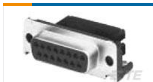
TE 产品编号5745992-3 25 MSFL RCPT RA 590 (IN,FM)