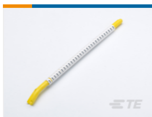
TE 产品编号 CAT-T3437-ST2999 STD Snap-On Markers