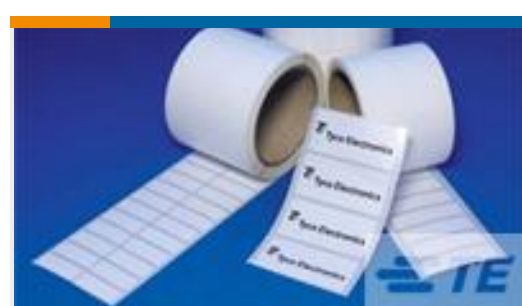
TE 产品编号 4-1768019-2 EET-M0080P-9