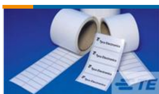
TE 产品编号 5-1768019-2 EET-M0105P-9