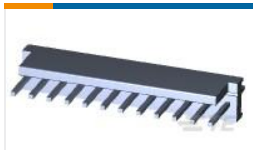
TE 产品编号1-640454-2 12P MTA100 HDR ASSY SQ STR POL