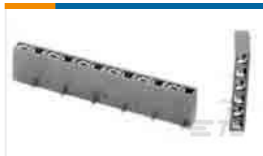
TE 产品编号1241152-4 4P HV100 REC. CON, SMD, GOLD, BLISTER