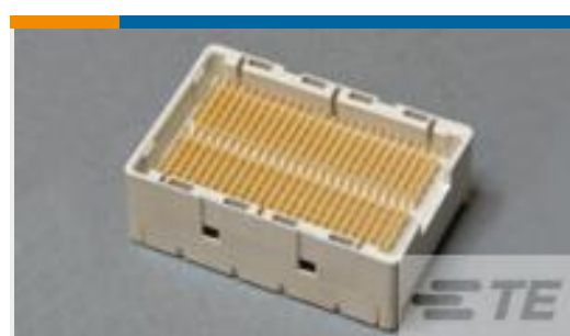
TE 产品编号 6-1761616-3 STEP-Z PLUG 13MM 296P LF ST