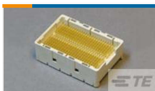
TE 产品编号 6-1761616-2 STEP-Z PLUG 12MM 296P LF ST