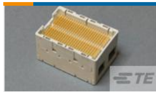
TE 产品编号 7-1761616-5 STEP-Z PLUG 25MM 296P LF ST