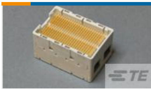
TE 产品编号 7-1761616-0 STEP-Z PLUG 20MM 296P LF ST