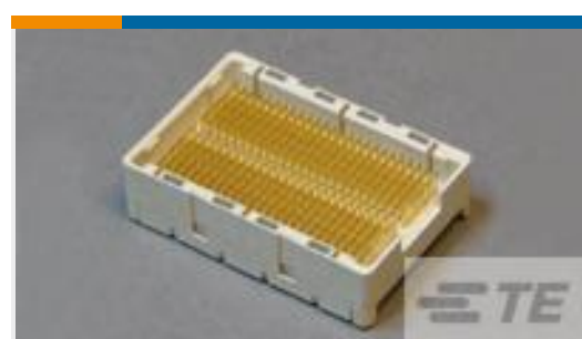
TE 产品编号 6-1761616-0 STEP-Z PLUG 10MM 296P LF ST