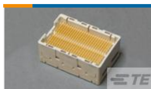
TE 产品编号 6-1761616-5 STEP-Z PLUG 15MM 296P LF ST