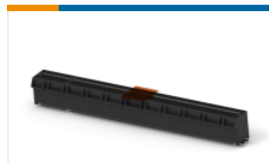
TE 产品编号 5-2337939-4 PCIE GEN4 CON,SMT,164POS,30u", MYLAR,HT