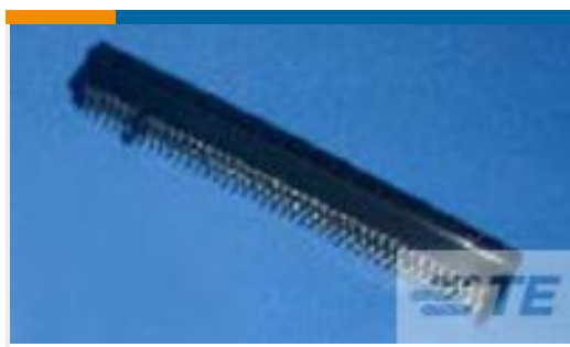
TE 产品编号 1734774-1 PCI EXP 3.1L 36 POS WHT G/F