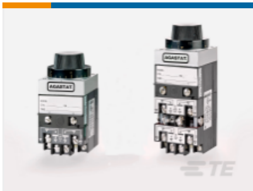
TE 产品编号 3-1423159-3 7012PJ=RLY,STD,ON,2P,125VDC,1