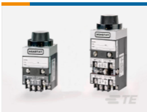
TE 产品编号 2-1423162-9 7022BK=RLY,STD,OFF,M2P,240VAC,