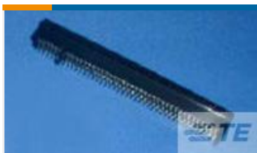
TE 产品编号 1734774-1 PCI EXP 3.1L 36 POS WHT G/F