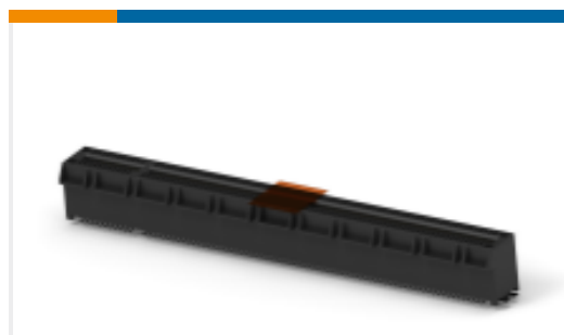
TE 产品编号 5-2337939-4 PCIE GEN4 CON,SMT,164POS,30u", MYLAR,HT