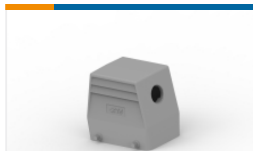
TE 产品编号T1319320120-000 H32A-TS-M20