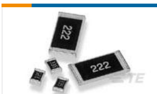
TE 产品编号3-2176067-2 CRG0201 1% 44R2