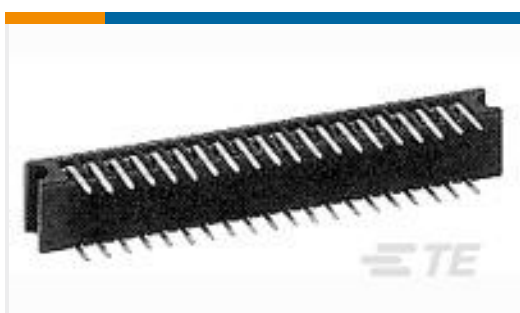
TE 产品编号7-532956-0 130 MODII 2PC CE RCPT ASSY, RoHS