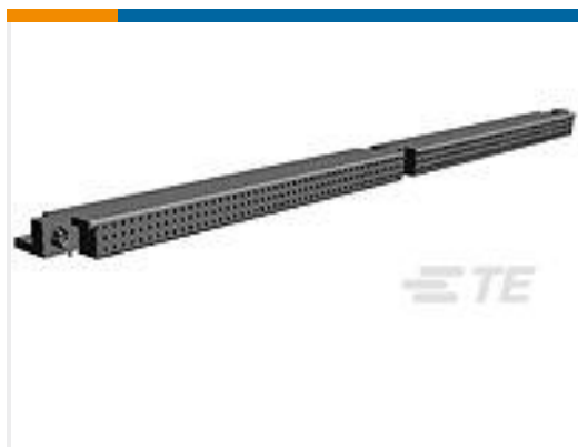
TE 产品编号5533514-6 ASSY,RECPT,R.ANGLE,HDI,LEAD-FR