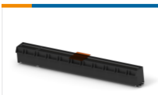
TE 产品编号 5-2337939-4 PCIE GEN4 CON,SMT,164POS,30u", MYLAR,HT