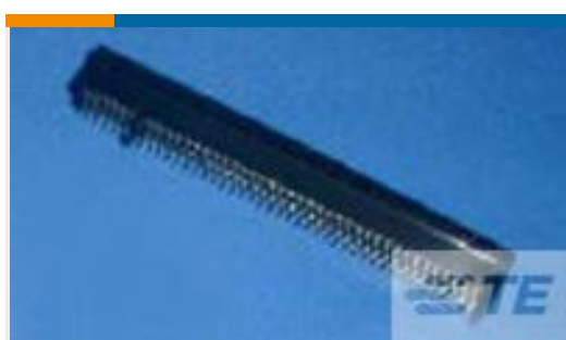
TE 产品编号 1734774-1 PCI EXP 3.1L 36 POS WHT G/F