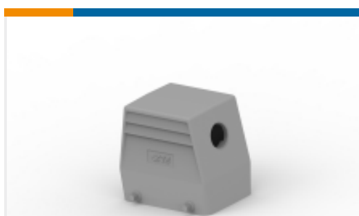
TE 产品编号T1319320120-000 H32A-TS-M20