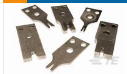
TE 产品编号8-571039-3 INSULATION CRIMPER