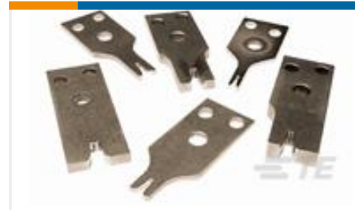
TE 产品编号3-1707327-7 WIRE CRIMPER