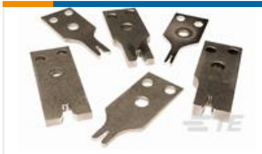
TE 产品编号2076539-2 INSULATION CRIMPER SPECIAL