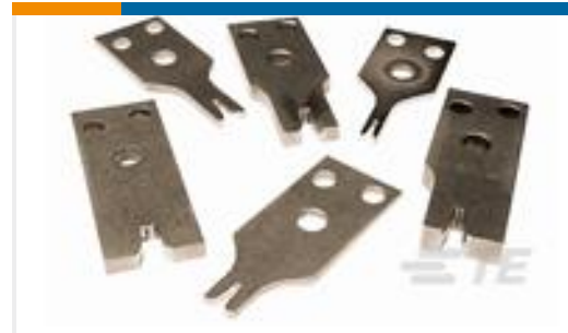
TE 产品编号2076539-3 INSULATION CRIMPER SPECIAL