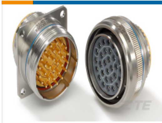
TE 产品编号ZPF000000000036945 983-6SE 14-04 SN-L