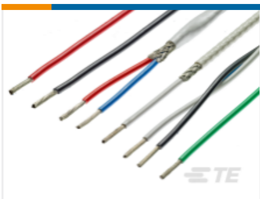
TE 产品编号3643333001 100G0121-0.60-9/9