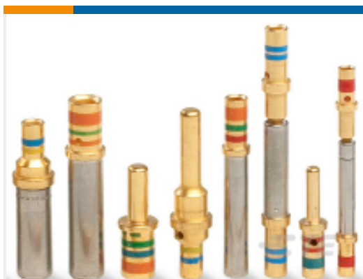
TE 产品编号ZPF00000000001233 097-0165-12