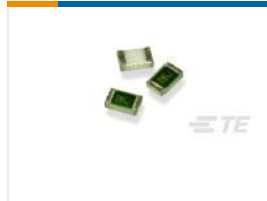
TE 产品编号1-1879336-4 CPF 0603 316R 1% 50PPM 1K RL