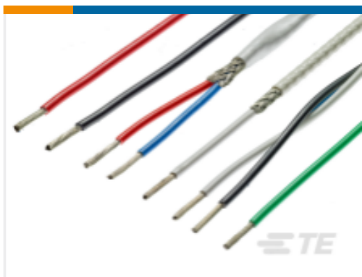
TE 产品编号7672673001 100G0121-0.40-9/9