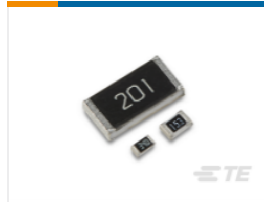
TE 产品编号2-2176330-7 CRGP 2010 1K5 1%