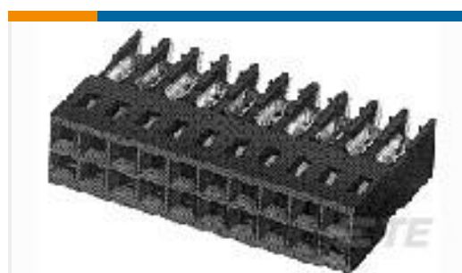
TE 产品编号102393-6 16 AMPMODU MT ASSY DR .100CL