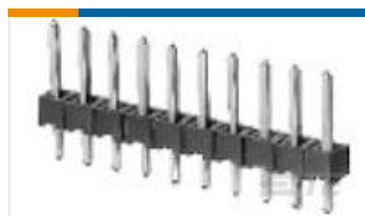
TE 产品编号6-146280-5 15 MODII HDR SRST B/A .100CL