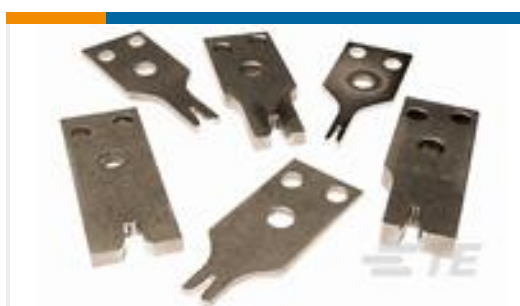
TE 产品编号1-456412-8 CRIMPER, WIRE .180F