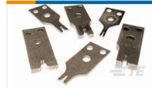
TE 产品编号4-683453-8 CRIMPER, INSULATION "F" (.070")