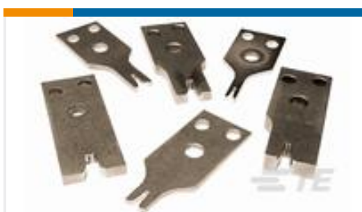
TE 产品编号3-456134-1 CRIMPER INSUL F