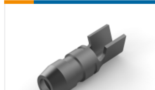
TE 产品编号1742083-1 SHUR PLUG .156 DIA REC 18-14 AWG PPBR