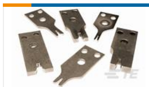
TE 产品编号2-456408-8 CRIMPER WIRE .110 "F"