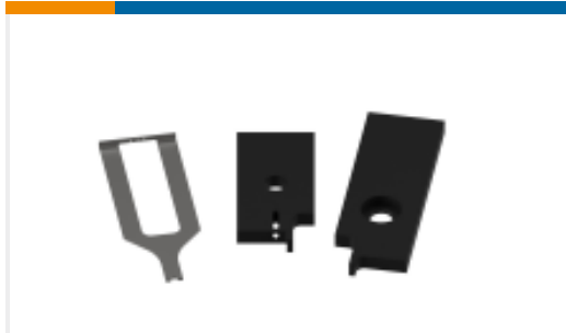
TE 产品编号1490525-2 DEPRESSOR, WIRE