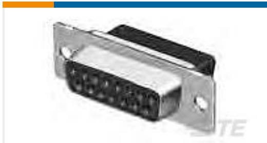
TE 产品编号205203-8 CRIMP SNAP RCPT ASSY,SIZE 1