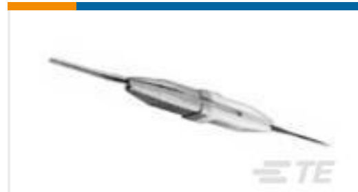
TE 产品编号91067-2 INSERTION/EXTRACTION TOOL