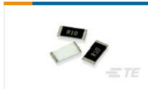
TE 产品编号2-1879461-5 RL73H 2A R13 1% 1K RL