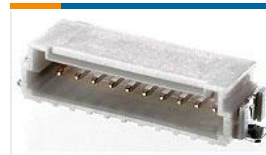
TE 产品编号5-292227-3 1.5 MINI CT SGL H SMT W BOSS 3