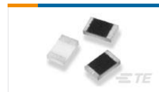
TE 产品编号4-1624108-5 3640 0402 2.3nH +/-0.2nH 1K RL