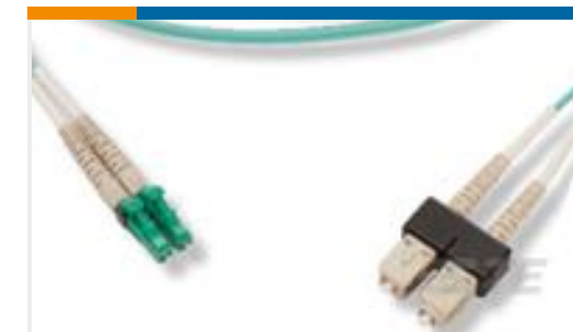
TE 产品编号8-1920985-1 FOMM62.5 LEAD LC/DPX ODVA - SC /DPX 120M