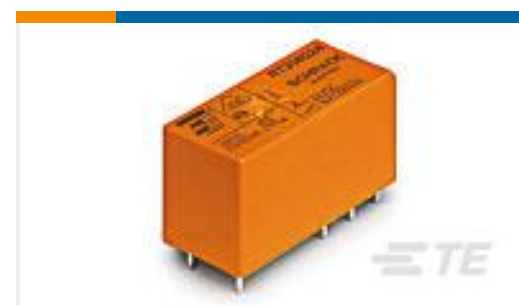
TE 产品编号9-1393239-1 RT314005