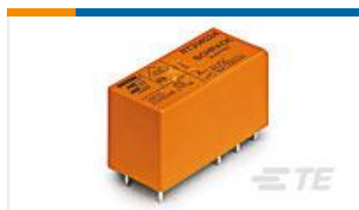
TE 产品编号3-1393240-5 RT33L024