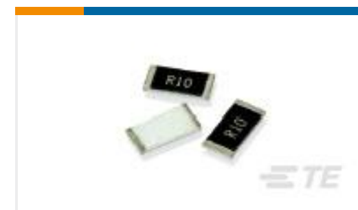
TE 产品编号5-1622824-1 RL73N 1E R15 5% 5K RL