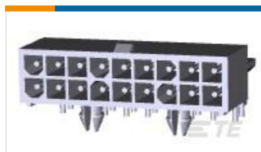
TE 产品编号1-794105-1 18P MINI UMNL R/A HDR ASSY LF