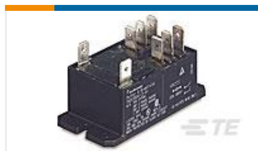
TE 产品编号9-1393211-0 T92S11D12-24