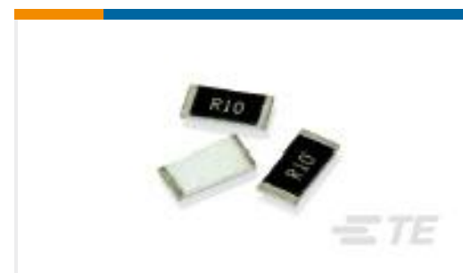
TE 产品编号2-2176050-6 RLP73K 1E R56 5% 5K RL