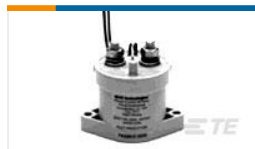
TE 产品编号1618002-7 EV200AAANA=RELAY, EV200 SPST-N