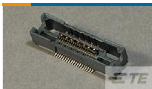
TE 产品编号5767096-8 MICT, REC, 038, ASY, .025, TAPE, CAP