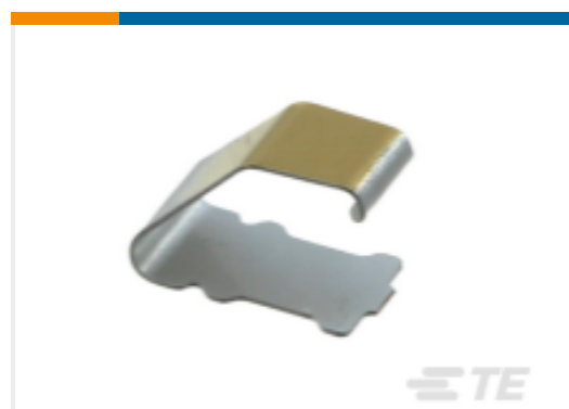
TE 产品编号1734300-1 SHIELD FINGER 3025-Z1-T