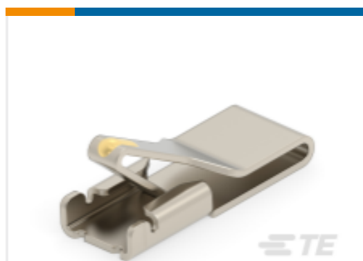
TE 产品编号2329497-2 SPRING FINGER 1.15H