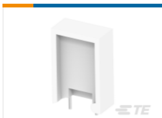
TE 产品编号2176633-9 SQMB10 2R2 (WIRE) 5%