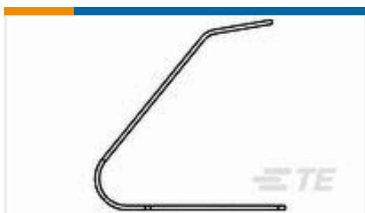
TE 产品编号1734298-1 Shield Finger 6525