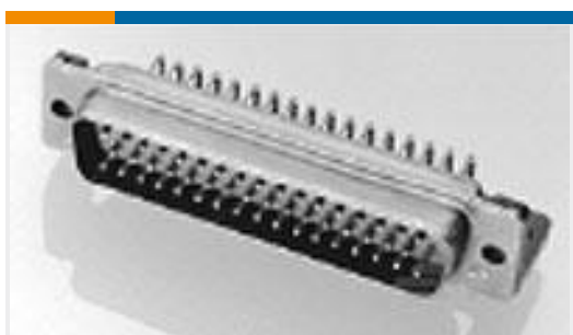
TE 产品编号1218408-1 AMPLIMITE, ASY, RCPT, RTANG, 109, 1