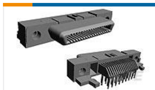
TE 产品编号5796055-1 68 CHAMP R/A ASSY, LC