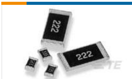
TE 产品编号1623171-1 CRG0805 1% 27R