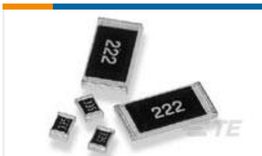
TE 产品编号1623129-1 CRG0805 1% 18R