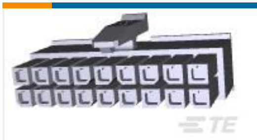
TE 产品编号1-794617-8 18POS,MICRO MNL,RCPT HSG