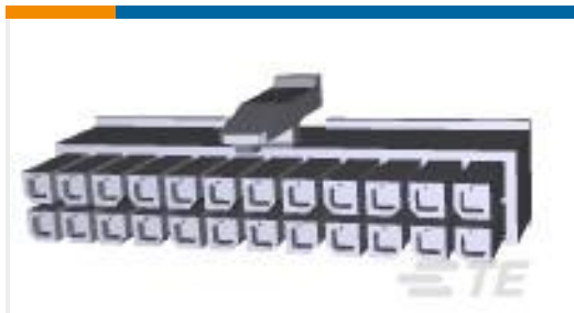
TE 产品编号2-794617-4 24POS,MICRO MNL,RCPT HSG