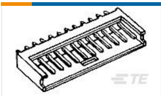
TE 产品编号280370-3 2P AMPMODU II SHRD HDR, ST, 0.76 AU