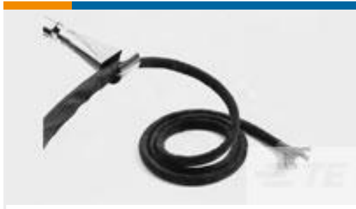
TE 产品编号CB7839-000 RW-200-1/2-0-SP