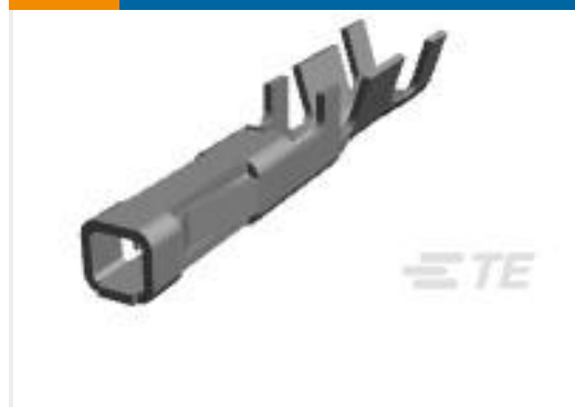
TE 产品编号1-794610-2 MICRO MNL RPT CNT,LS PC 30AU L