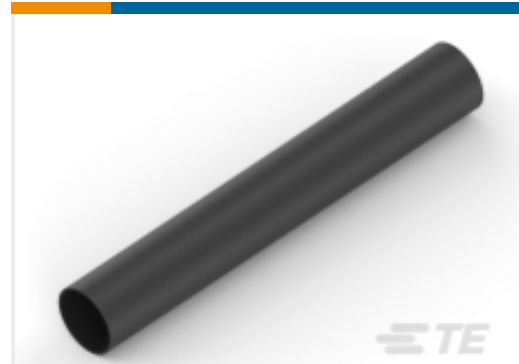
TE 产品编号NB09952001 ATUM-19/6-0-STK