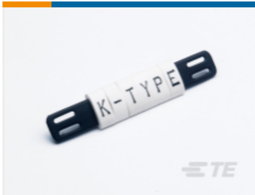
TE 产品编号EC6455-000 K-Type Tie-On Markers