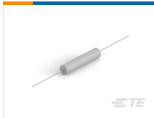
TE 产品编号4-2176415-5 8W STD M/OX 5% 2K0