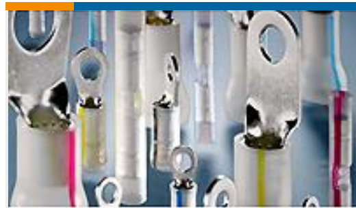
TE 产品编号53427-1 TERMINAL,PIDG PVF2 R 12-10