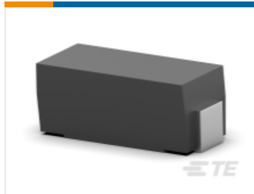
TE 产品编号2176460-8 SMF 7W 2K2 5% Taped