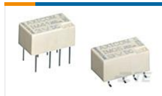
TE 产品编号5-1462037-9 IM43GR=IM RELAY 100mW 5V BIS