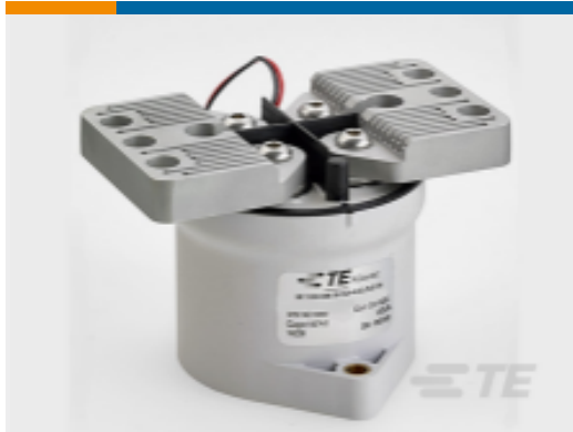
TE 产品编号6-1618413-9 K1K06H024EAGA=CONTACTOR SPST-NO W/AUX