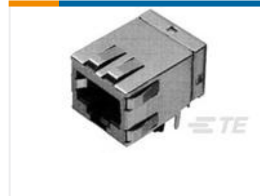
TE 产品编号5406296-1 MJ ASSY,S/P,8P,SHLD,RVPGT,CAT5E