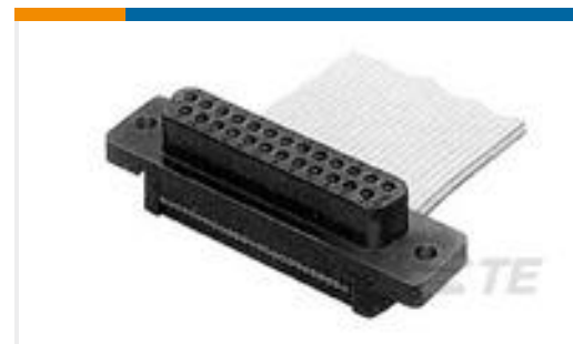
TE 产品编号1658614-3 15 POS HDF RCPT, AP, LEAD FREE