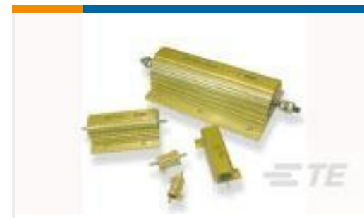
TE 产品编号9-1625971-6 HSA25 5R6 5%