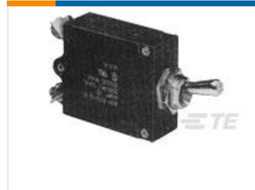
TE 产品编号4-1393247-1 W31-X2M1G-40=W23/W31