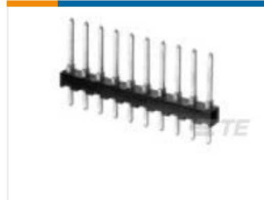
TE 产品编号825440-5 MOD 2 PINHDR 2X05P.