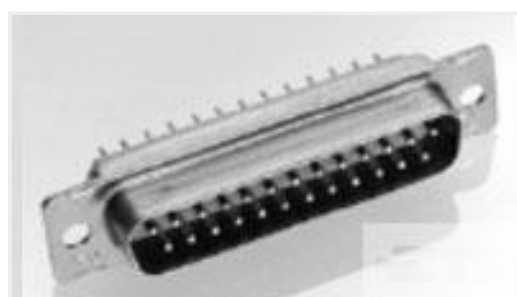
TE 产品编号205414-1 AMPLIMITE,ASY,PLUG,FB,109,4