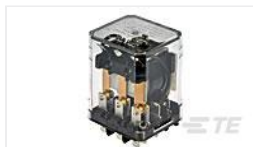
TE 产品编号3-1393118-1 KUP-14D45-110=KU