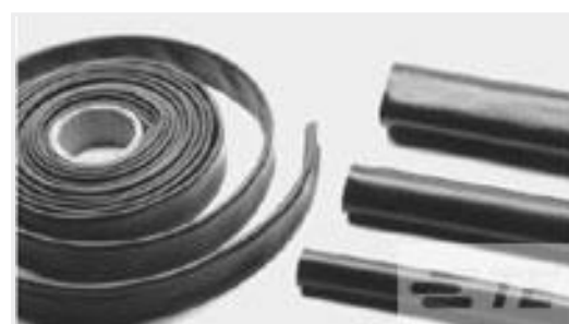
TE 产品编号CB5443-000 XFFR-20X4