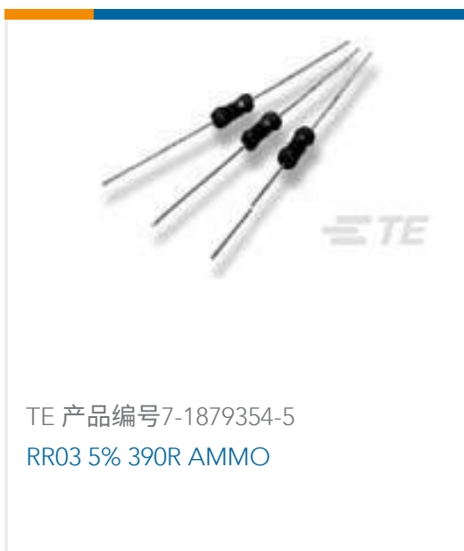
TE 产品编号7-1879354-5 RR03 5% 390R AMMO