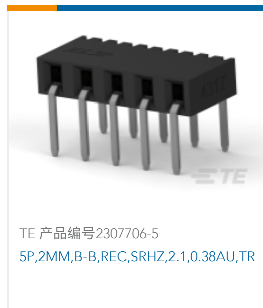
TE 产品编号2307706-5 5P,2MM,B-B,REC,SRHZ,2.1,0.38AU,TR