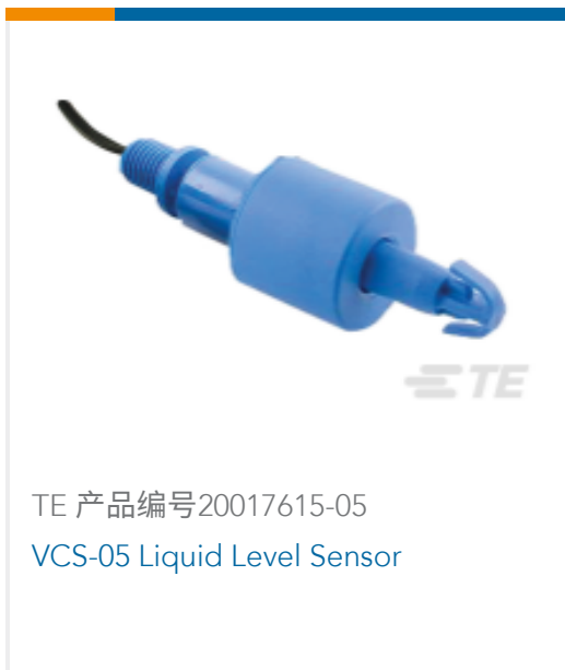
TE 产品编号20017615-05 VCS-05 Liquid Level Sensor