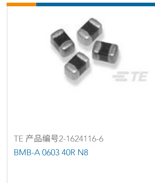
TE 产品编号2-1624116-6 BMB-A 0603 40R N8