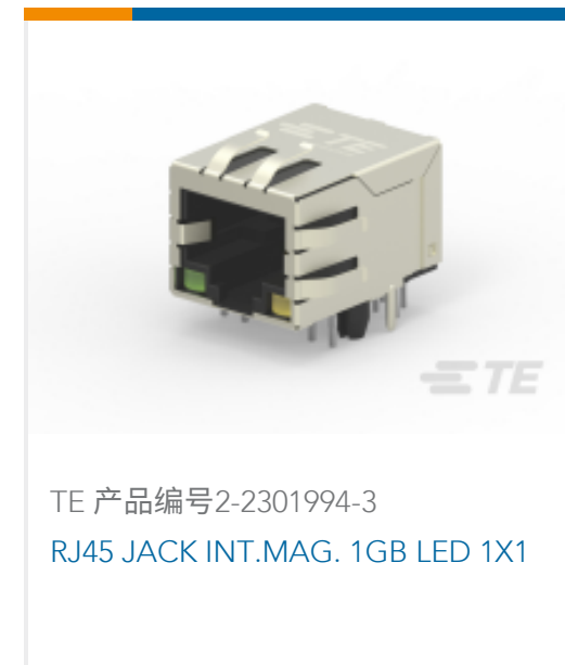
TE 产品编号2-2301994-3 RJ45 JACK INT.MAG. 1GB LED 1X1