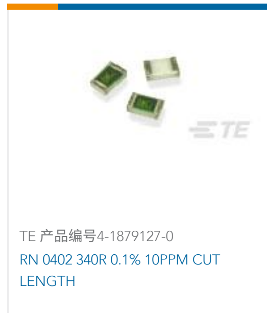
TE 产品编号4-1879127-0 RN 0402 340R 0.1% 10PPM CUT LENGTH