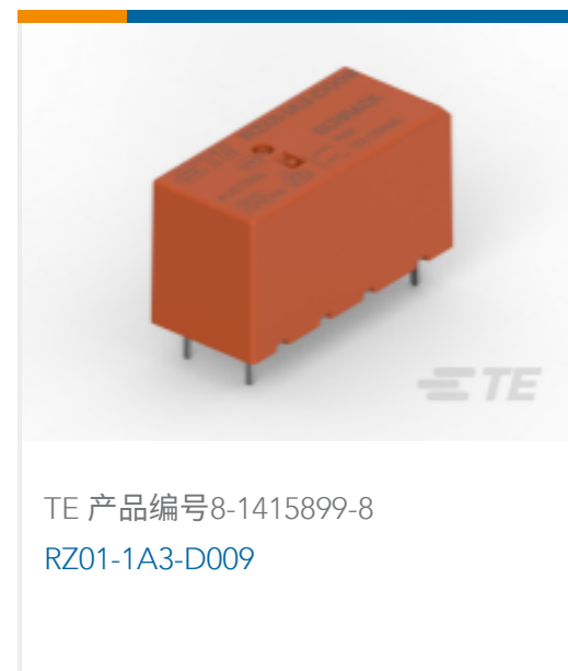
TE 产品编号8-1415899-8 RZ01-1A3-D009