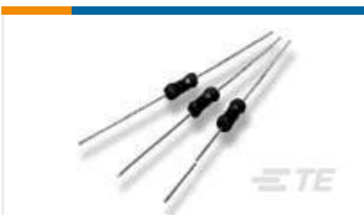
TE 产品编号7-1625890-0 2W SM M/OX 5% 82K