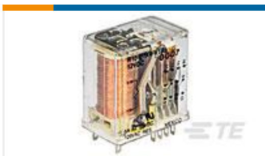
TE 产品编号1-1393767-5 R10-E2X2-V700=R10