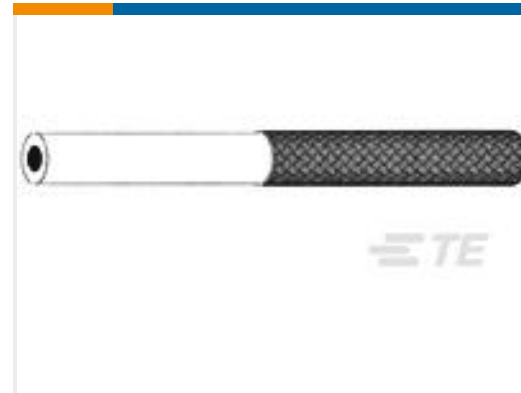
TE 产品编号E234513001 RAY-103-10.0(100)