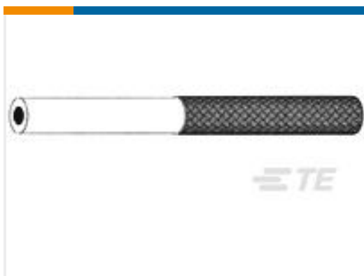
TE 产品编号D209003001 RAY-103-7.5(100)