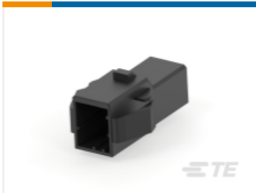
TE 产品编号1-1318116-3 Receptacle and Tab Housing: 2.5 mm Pitch, 250V