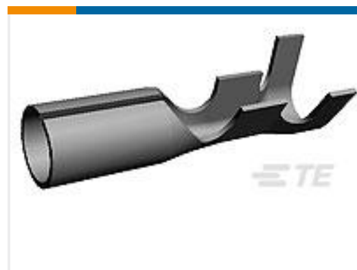
TE 产品编号170021-1 SHUR PLUG RECEPTACLE 20-16 AWG TPBR