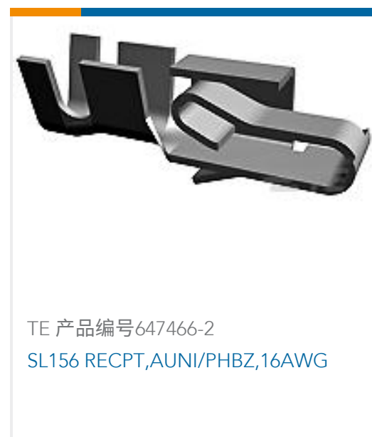
TE 产品编号647466-2 SL156 RECPT,AUNI/PHBZ,16AWG