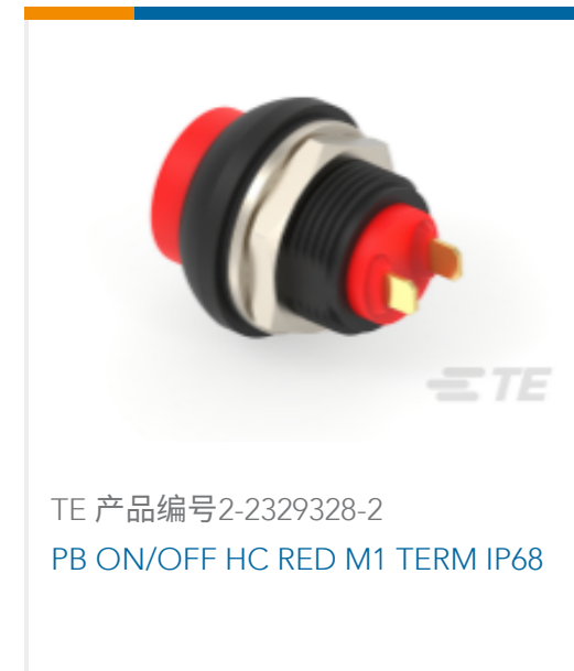
TE 产品编号2-2329328-2 PB ON/OFF HC RED M1 TERM IP68