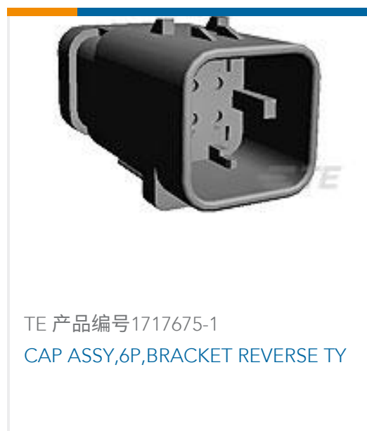
TE 产品编号1717675-1 CAP ASSY,6P,BRACKET REVERSE TY