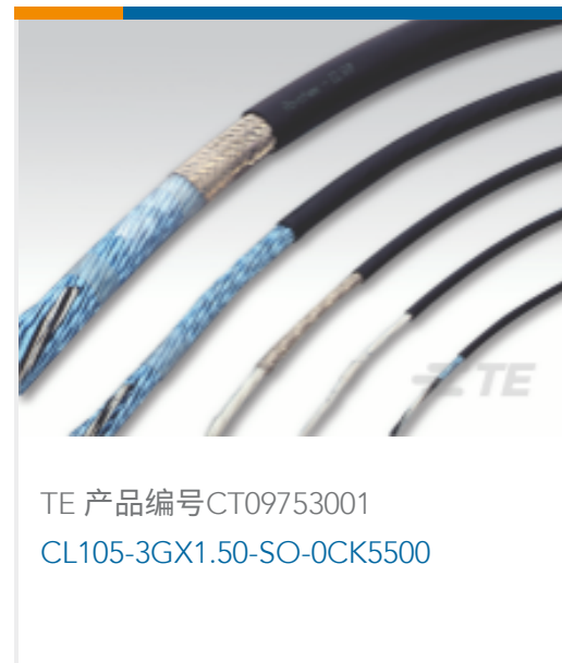
TE 产品编号CT09753001 CL105-3GX1.50-SO-OCK5500