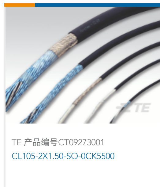
TE 产品编号CT09273001 CL105-2X1.50-SO-OCK5500