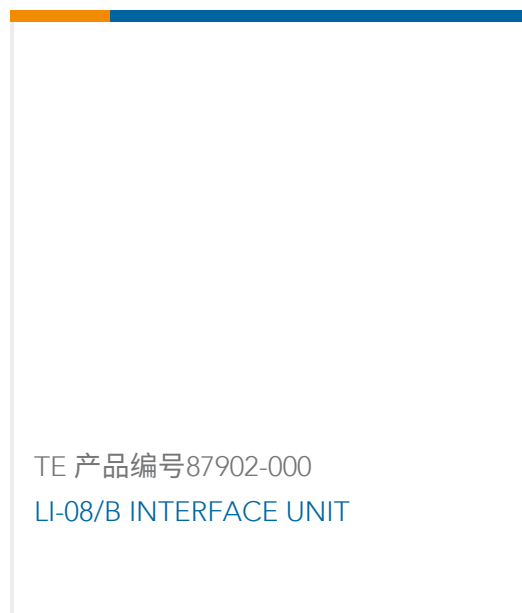
TE 产品编号87902-000 LI-08/B INTERFACE UNIT