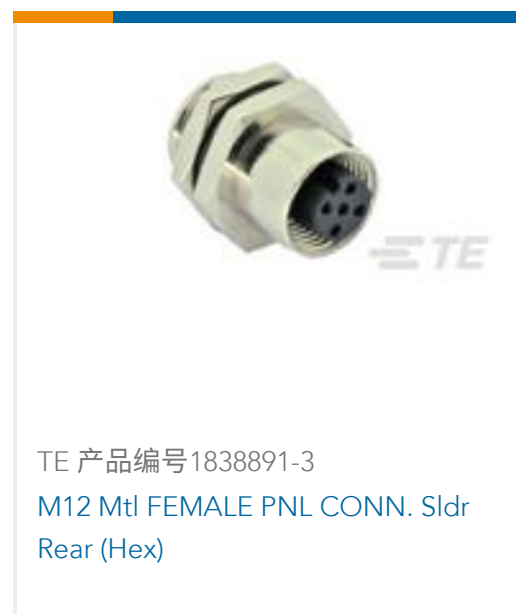
TE 产品编号1838891-3 M12 Mtl FEMALE PNL CONN. SlDr Rear (Hex)