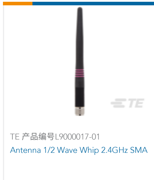
TE 产品编号L9000017-01 Antenna 1/2 Wave Whip 2.4GHz SMA