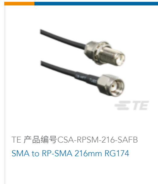
TE 产品编号CSA-RPSM-216-SAFB SMA to RP-SMA 216mm RG174