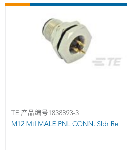
TE 产品编号1838893-3 M12 Mtl MALE PNL CONN. SlDr Re