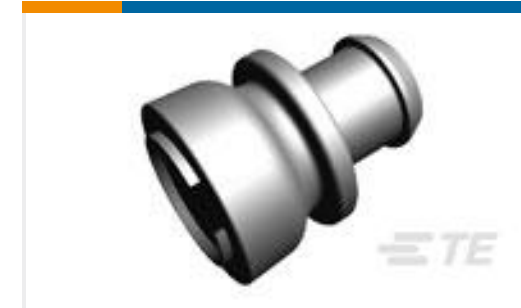
TE 产品编号828920-1 EINZELADERDICHUNG