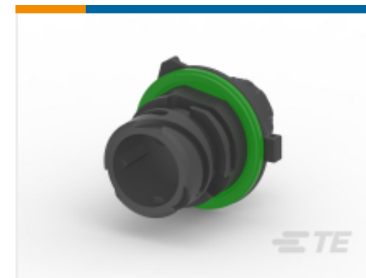
TE 产品编号1-967402-3 2,5MM ST-GEH KPL 2P