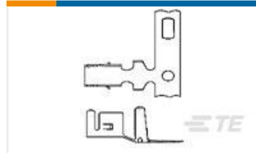
TE 产品编号3-770060-1 MINI AMP-IN PTLP/PHBZ