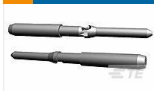
TE 产品编号174670-1 KEYING PLUG MINI U-M-N-L