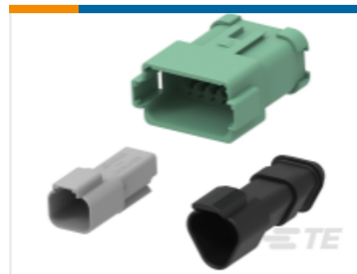
TE 产品编号DT04-4P-CE01 DEUTSCH DT Receptacle Connectors