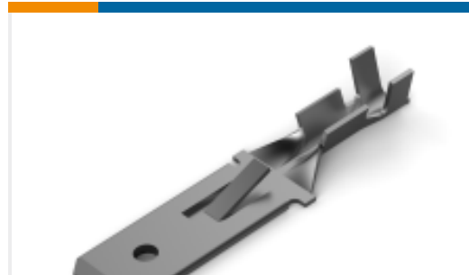
TE 产品编号928934-2 FF 250 TAB 20-17 AWG .015 TPBR