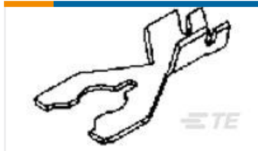
TE 产品编号42168-2 SPRING SPADE TERMINAL 18-14 AWG TPBR