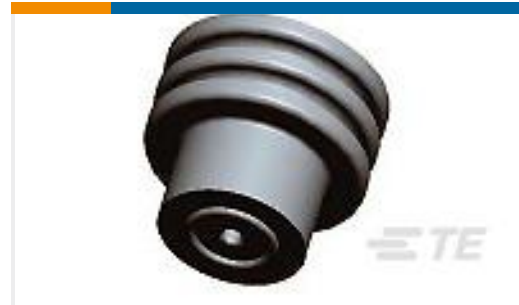
TE 产品编号2177018-1 SINGLE WIRE SEAL,AMP MCP6.3/4.8K, YW