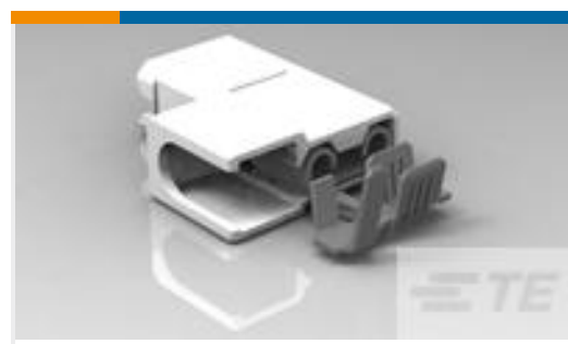
TE 产品编号520971-2 ULTRA-POD 250 ASY REC 18-14 AWG TPBR