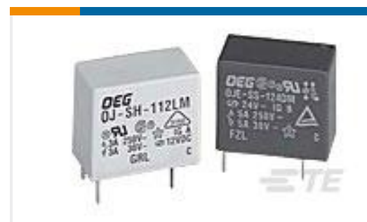
TE 产品编号1721538-7 OJ-SS-124HM2,000