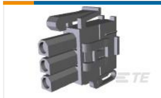
TE 产品编号794186-1 03P MINI UMNL2 PLUG HSG UL94V0