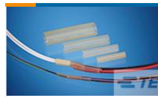
TE 产品编号CV07216001 DSPL-NR2-X-30MM