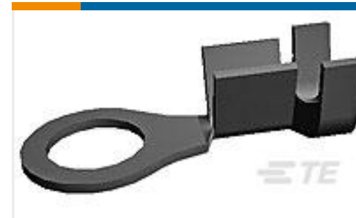
TE 产品编号160434-1 RING TONGUE WITH IS 20-16 AWG BR