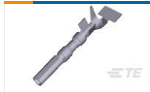
TE 产品编号794231-1 MINI UMNL2 SCKT 20-16AWG LP SN