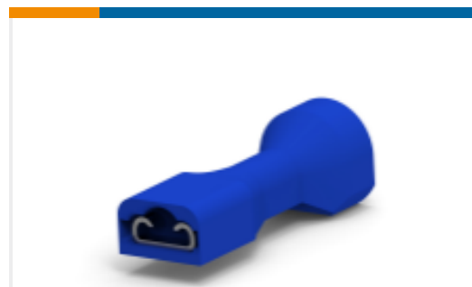
TE 产品编号3-1969626-1 187 ULTRA-FAST RCPT 16-14 TPBR