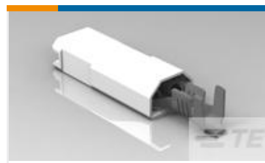
TE 产品编号520982-2 ULTRA-POD 187 ASSY REC 20-16 AWG TPBR