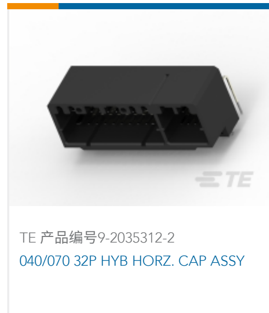
TE 产品编号9-2035312-2 040/070 32P HYB HORZ. CAP ASSY