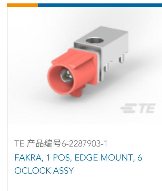
TE 产品编号6-2287903-1 FAKRA, 1 POS, EDGE MOUNT, 6 OCLOCK ASSY