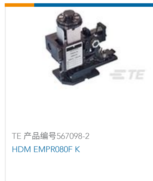
TE 产品编号567098-2 HDM EMPR080F K