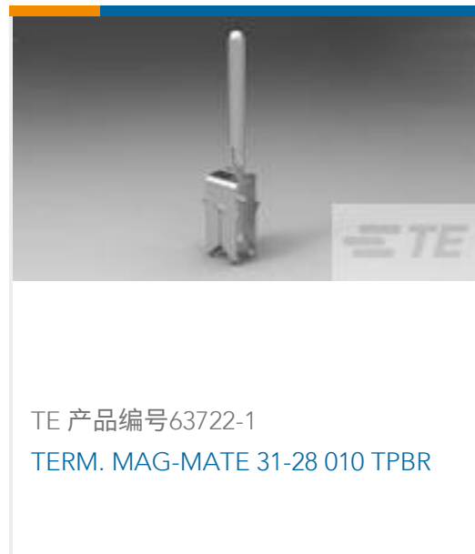
TE 产品编号63722-1 TERM. MAG-MATE 31-28 010 TPBR