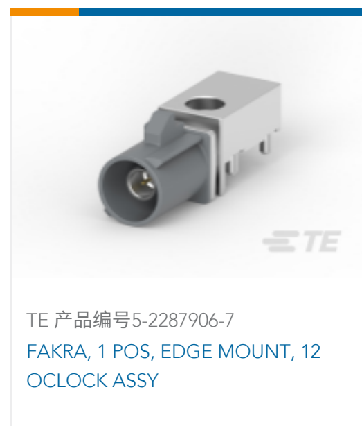
TE 产品编号5-2287906-7 FAKRA, 1 POS, EDGE MOUNT, 12 OCLOCK ASSY