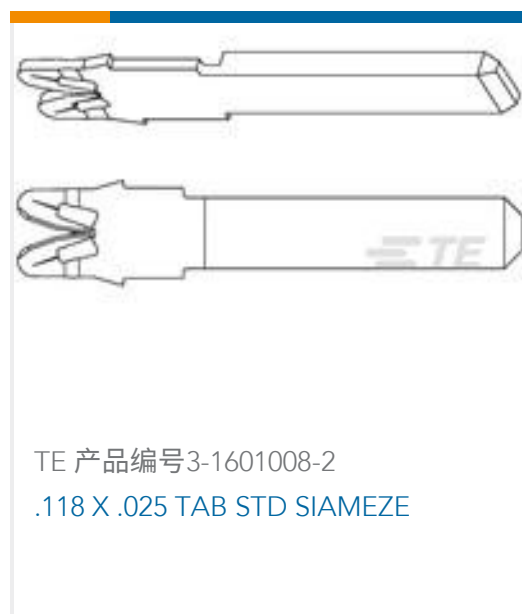
TE 产品编号3-1601008-2 .118 X .025 TAB STD SIAMEZE